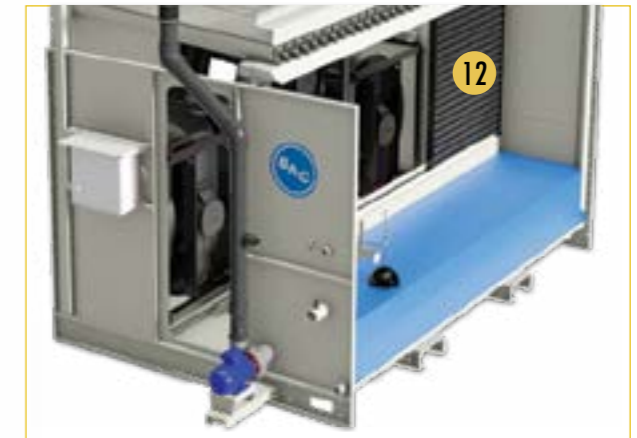
i Nur für Modelle der vorherigen Generation PLC 12. Lufteintritts-Schutzelemente