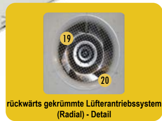
rückwärts gekrümmte Lüfterantriebssystem (Radial) - Detail