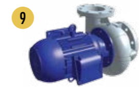
Sprühpumpe mit Gehäuse