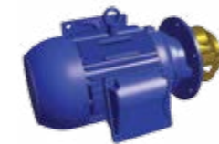
Sprühpumpe ohne Gehäuse